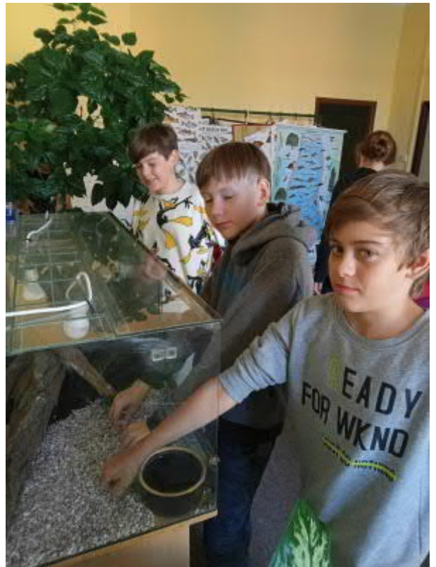
V kabinetě přírodopisu ve škole