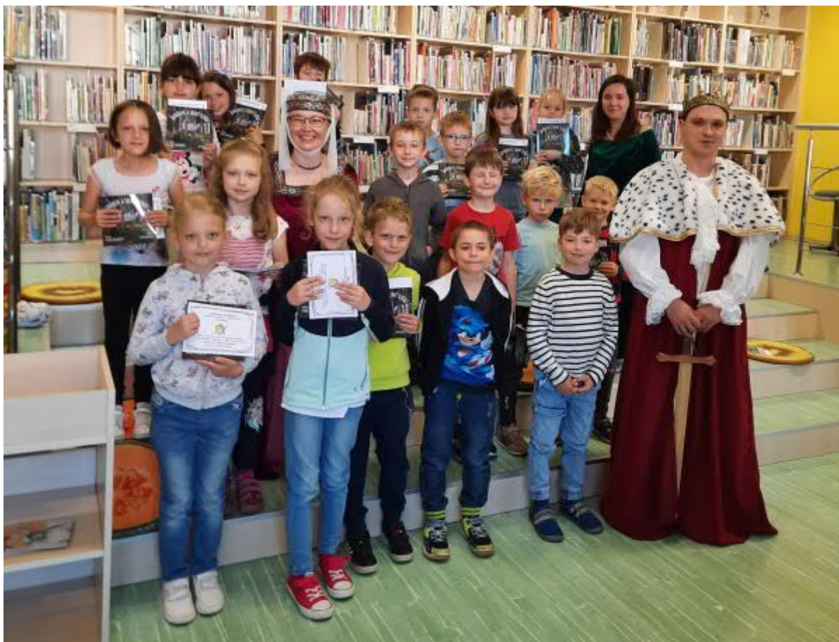
Pasování na čtenáře