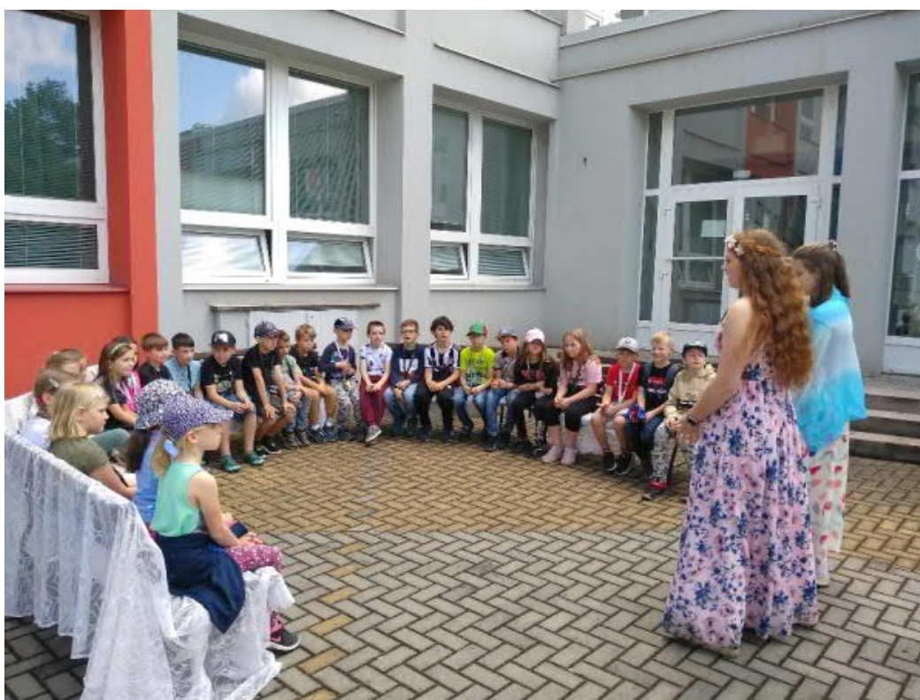
Bylinkové čarování na Slovanském gymnáziu pro prvňáčky