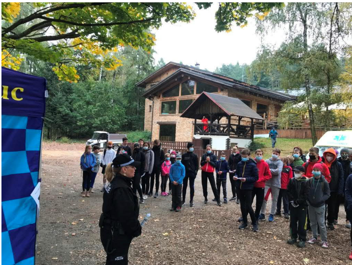
O putovní pohár primátora města Olomouce