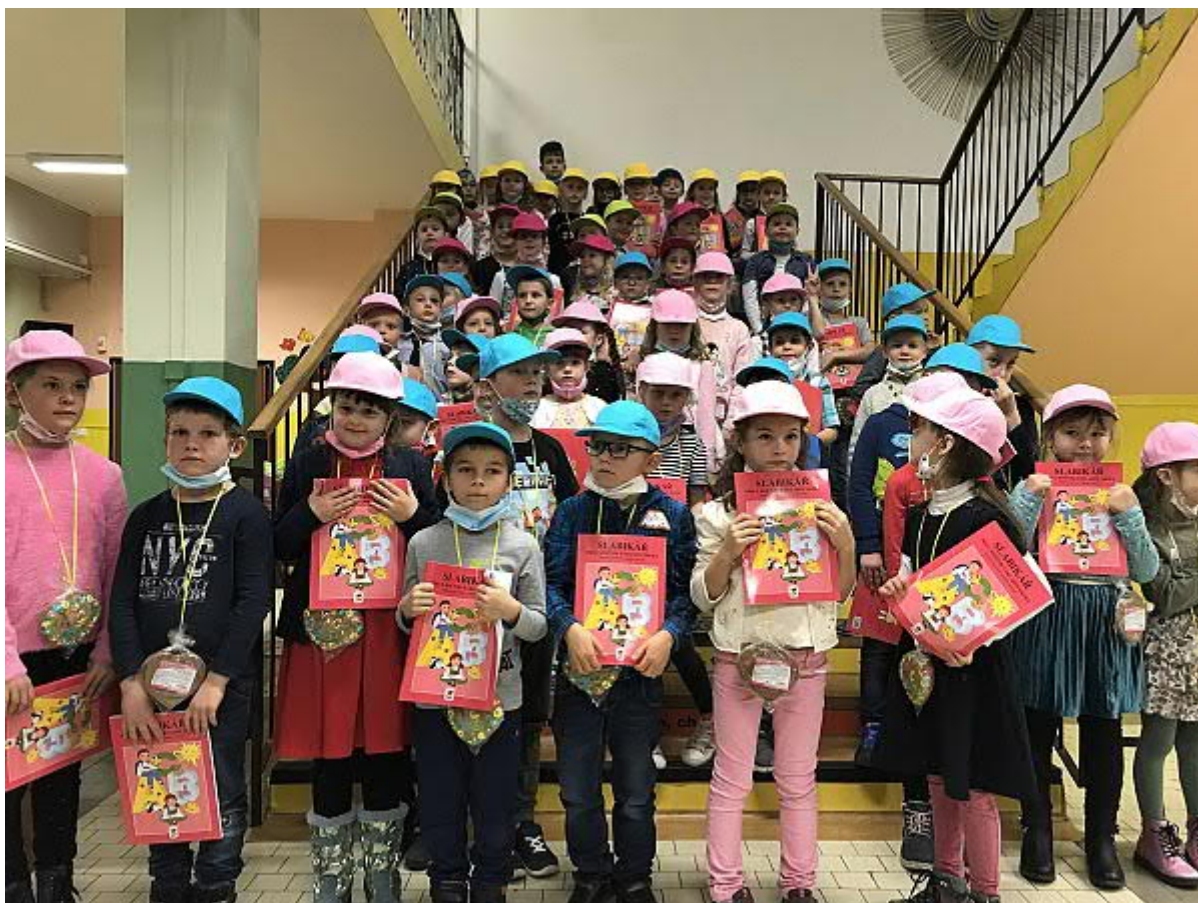
Slabikářování v 1. třídách