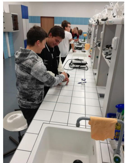
Na Střední škole logistiky a chemie v Olomouci