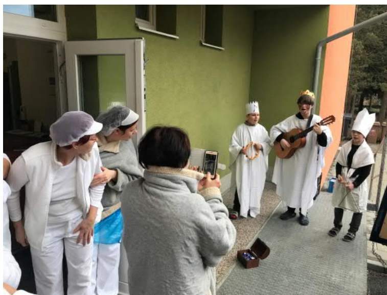
Tři králové ve školní jídelně Demlova