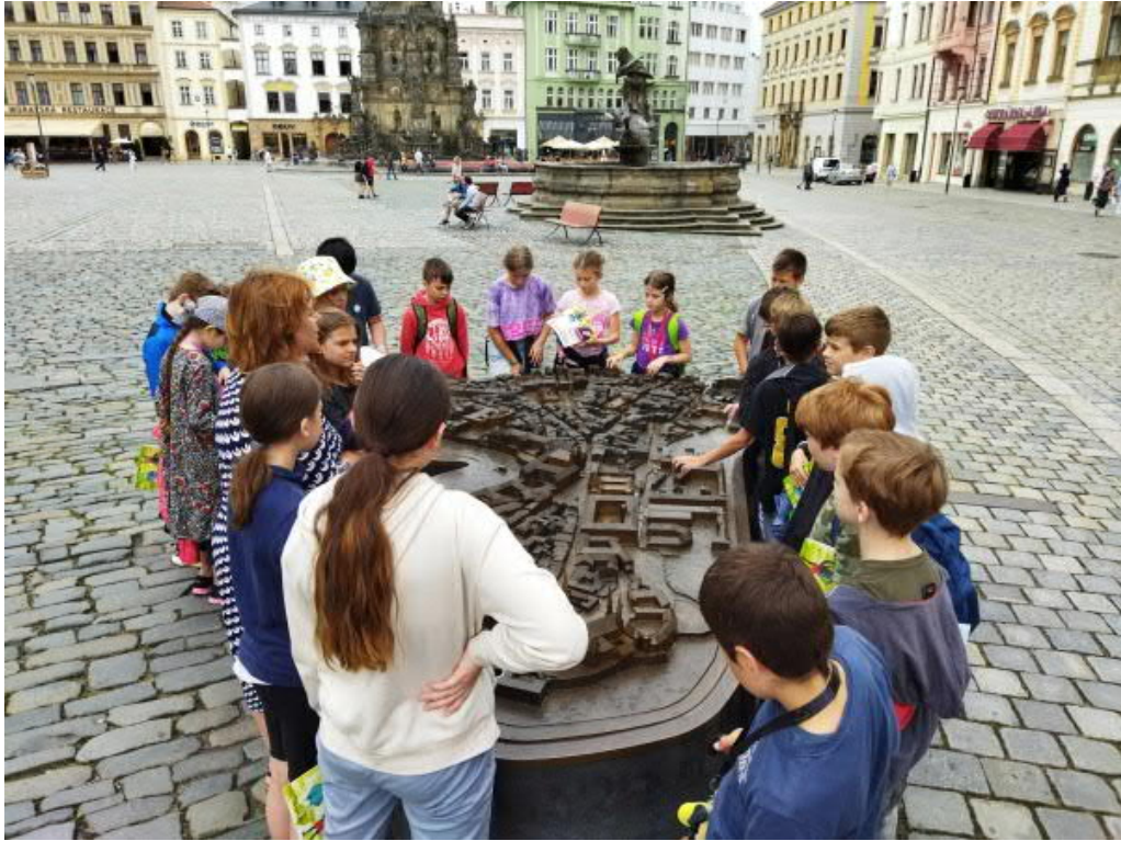
Olomouc s kočičkou Olou - procházky Olomoucí