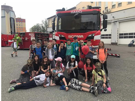
Na návštěvě u hasičů

Hlavní cíl: Všichni vyučující na škole jsou seznámeni s pojmem environmentální výchova a ekologie. Program environmentální výchovy je začleněn do výukových plánů všech předmětů, se zaměřením na olomoucký region. Prvky ekologické výchovy musí prolínat celým výchovným procesem.