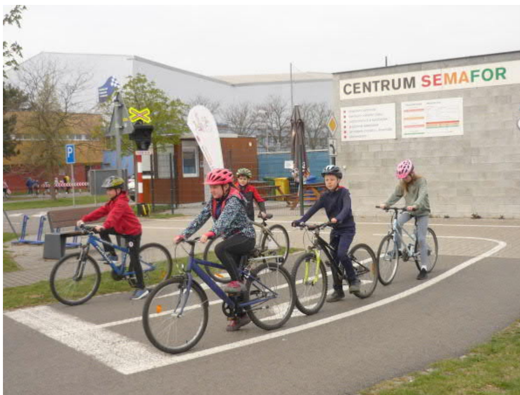
Žáci na dopravním hřišti v Olomouci- CRENTRUM SEMAFOR