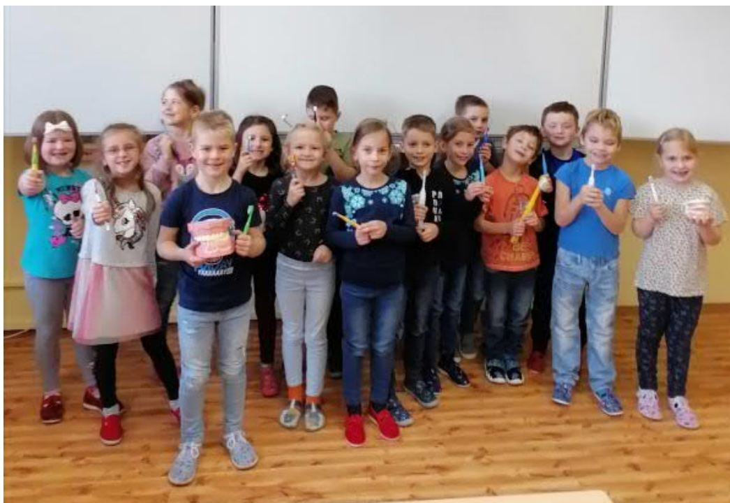
Beseda o dentální hygieně v prvních třídách