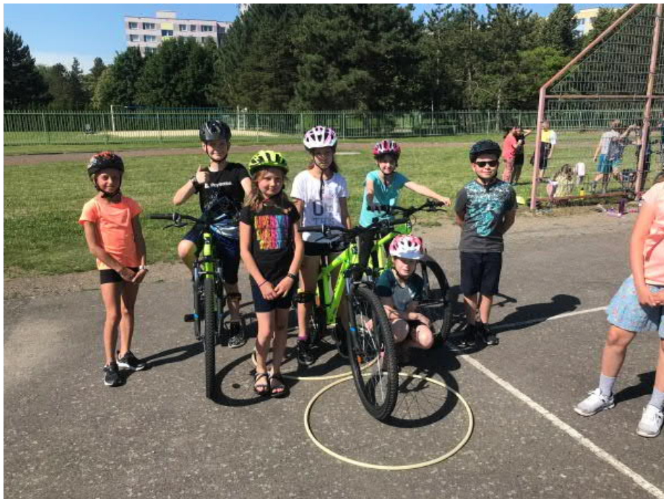
Jízda zručnosti v rámci dopravní výchovy