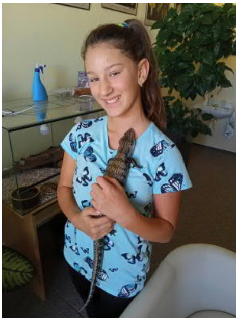
Zvířátka v kabinetě v péči žáků