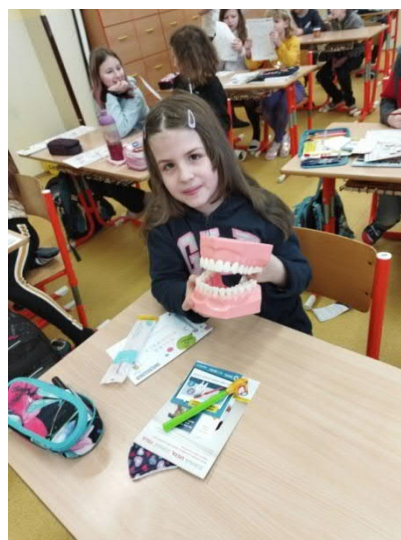
Dentální hygiena na 1. stupni