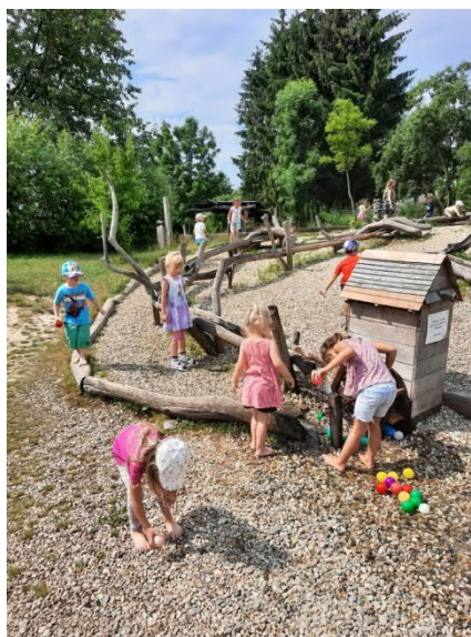
„Pradědovo dětské muzeum“